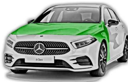
Abbildung 1: Aluminium in der Karosserie-Außenhaut der Mercedes-Benz A-Klasse (W177)