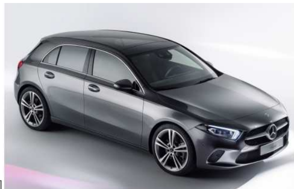
Mercedes-Benz A-Klasse (W177) [1]